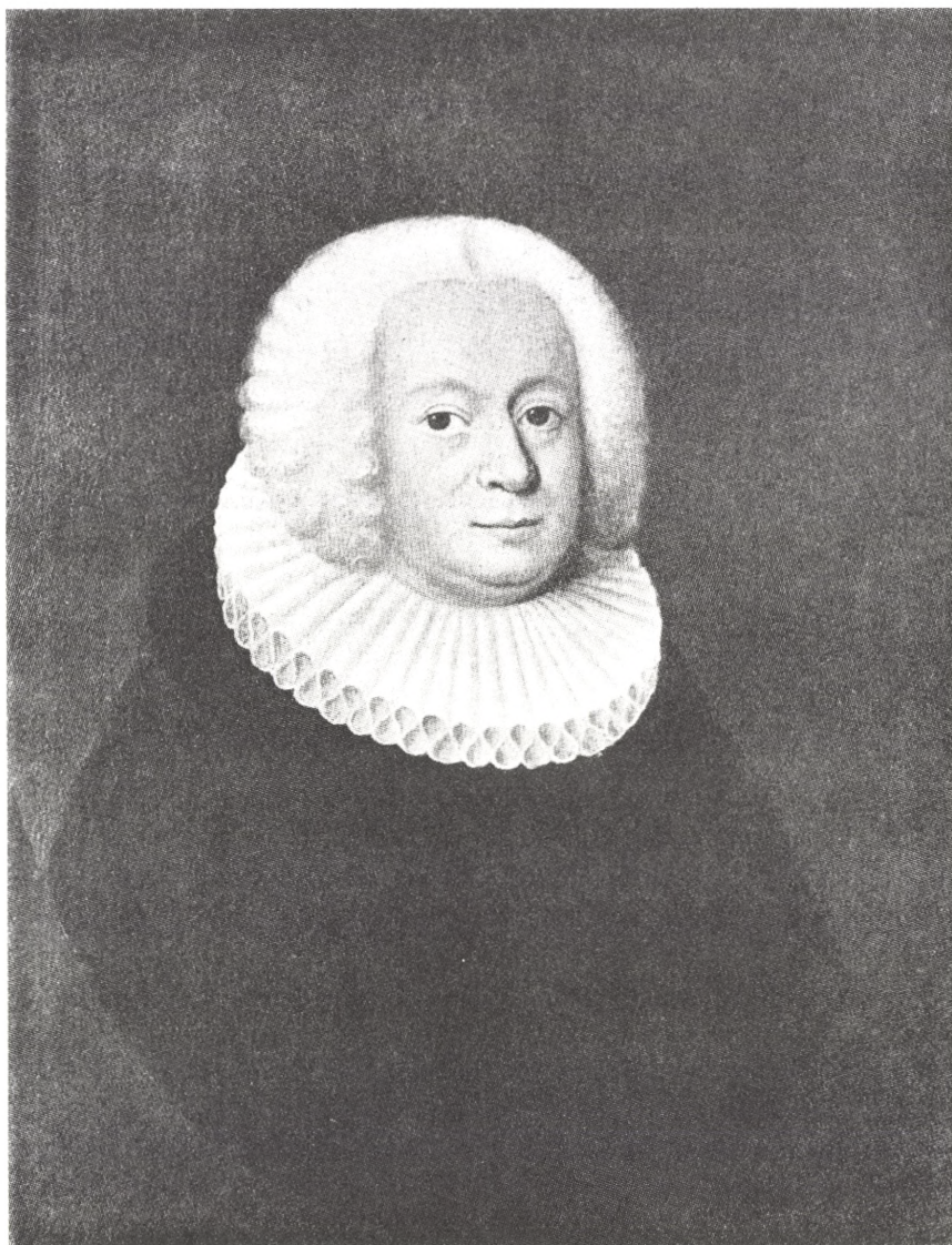
ERIK PONTOPPIDAN Ubekendt Maler Frederiksborgmuseet.